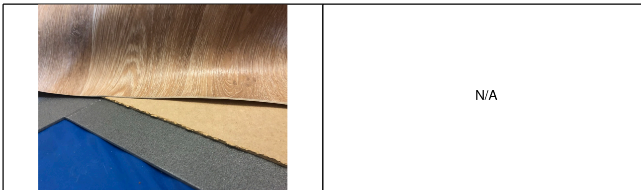
Illustration / drawing for sample assembly